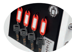
Crochets clés internes

L'image comprend les plateaux multimédias amovibles disponibles en option